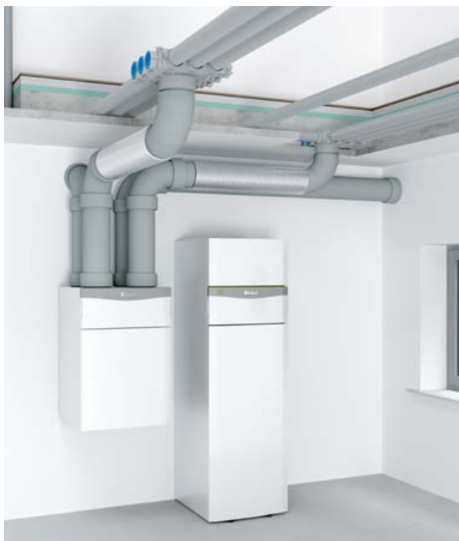
Elastyczne kanały wentylacyjne do każdych warunków zabudowy