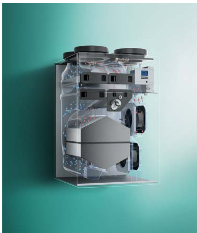
Filtry o dużej powierzchni i wbudowane obejście do trybu letniego