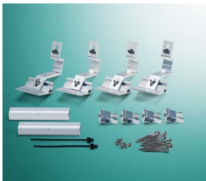
Sprawny montaż: nowy system mocowania