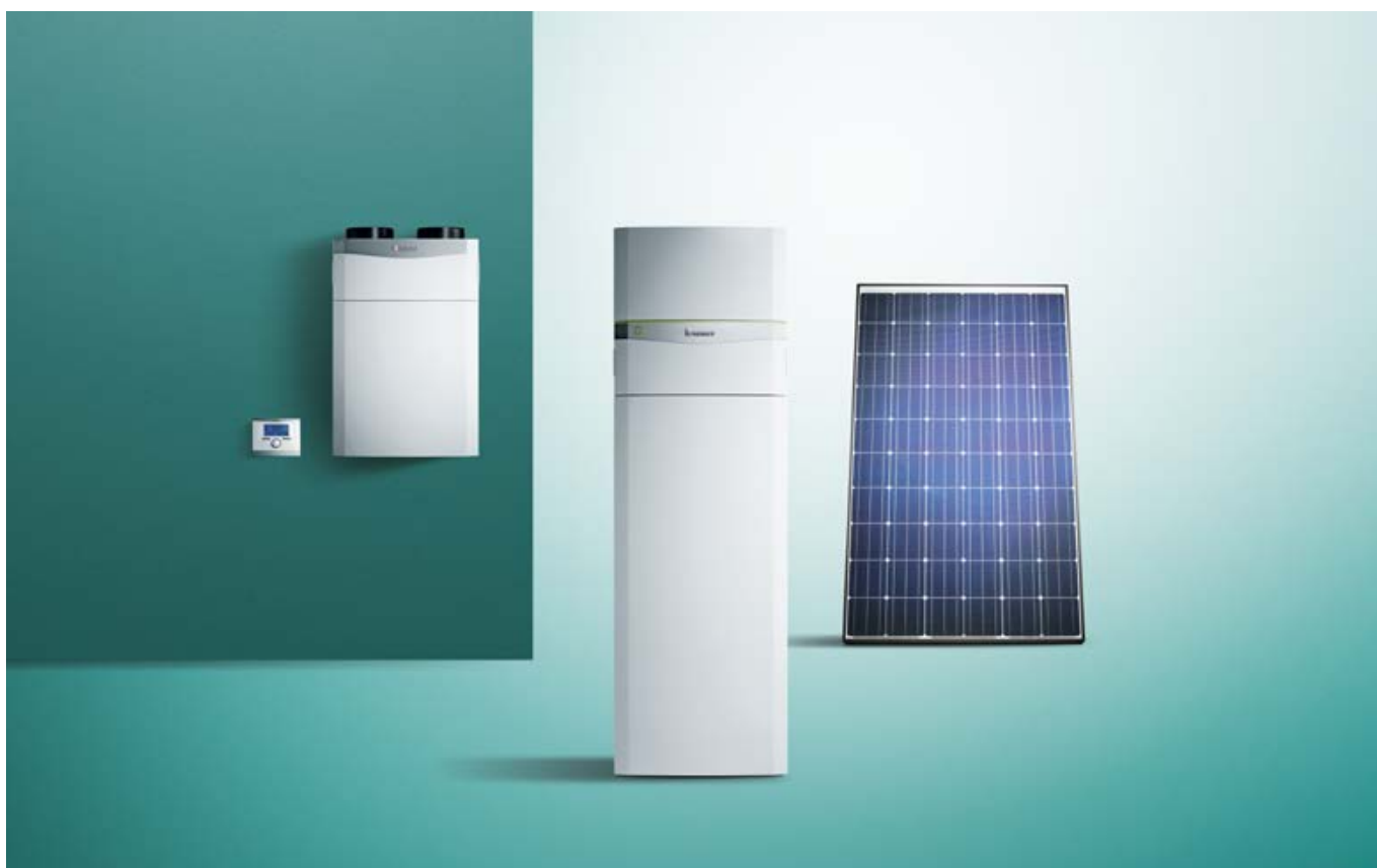
Przykład instalacji: wentylacja pomieszczeń mieszkalnych recoVAIR, pompa ciepła flexoCOMPACT exclusive, auroPOWER VPV P 320